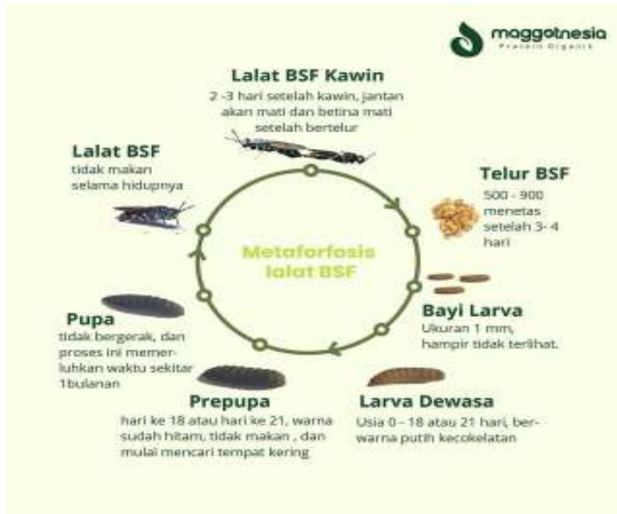
Gambar 2: Siklus Hidup Maggot BSF ( Hermetia illucens ).