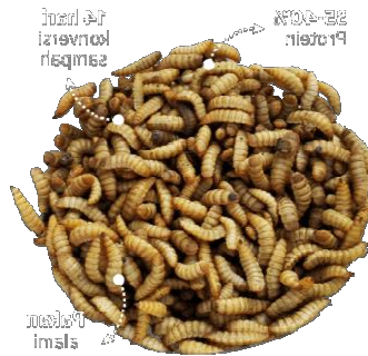
Gambar 1: Gambar Maggot Black Soldier Fly ( Hermetia illucens ).

Maggot merupakan organisme yang berasal dari telur maggot yang dikenal sebagai organisme pembusuk karena kebiasaannya mengkonsumsi bahan-bahan organik. Budidaya maggot sebagai sumber pakan ternak kini sudah tidak asing lagi. Maggot atau larva dari lalat BSF ( Hermetia illucens ) merupakan salah satu alternatif pakan yang memenuhi persyaratan sebagai sumber protein (Suciati dan Faruq, 2017).