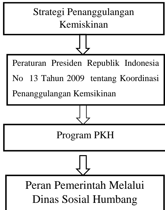
Gambar 2.1 Kerangka berpikir

Adapun kerangka berpikir dalam penelitian ini, peneliti menggambarkan melalui bagian sebagai berikut: