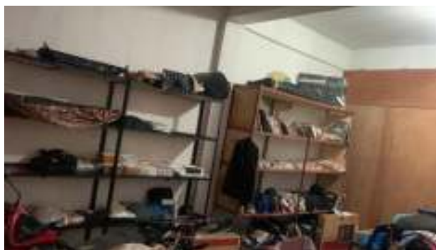
Foto Ruang Penyimpanan PT. Berkat Gadai Sumatera