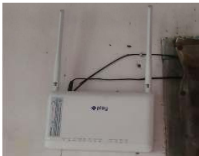
Gambar 2.1. Optical Network Termination