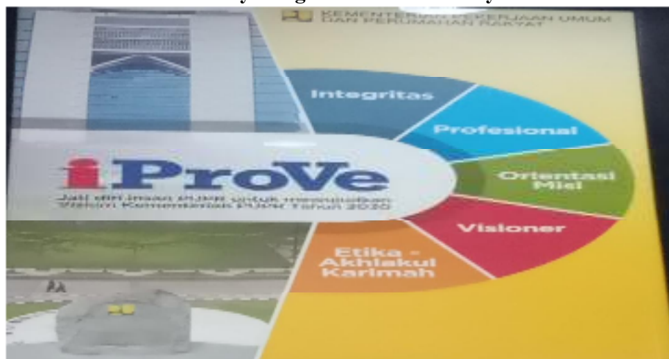
Gambar 1. 1 Budaya Organisasi PUPR Wilayah 1 Medan