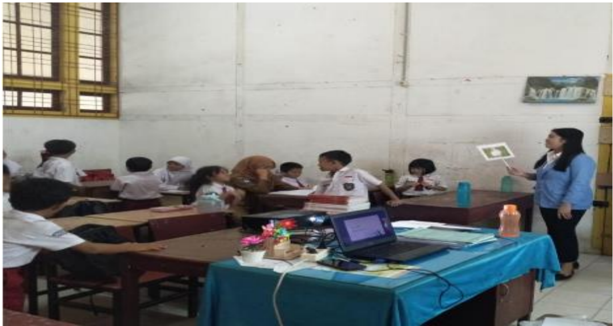
Gambar 1: Para tim pengabdian bersama guru-guru UPTD SD NEGERI 122332 Pematang Siantar