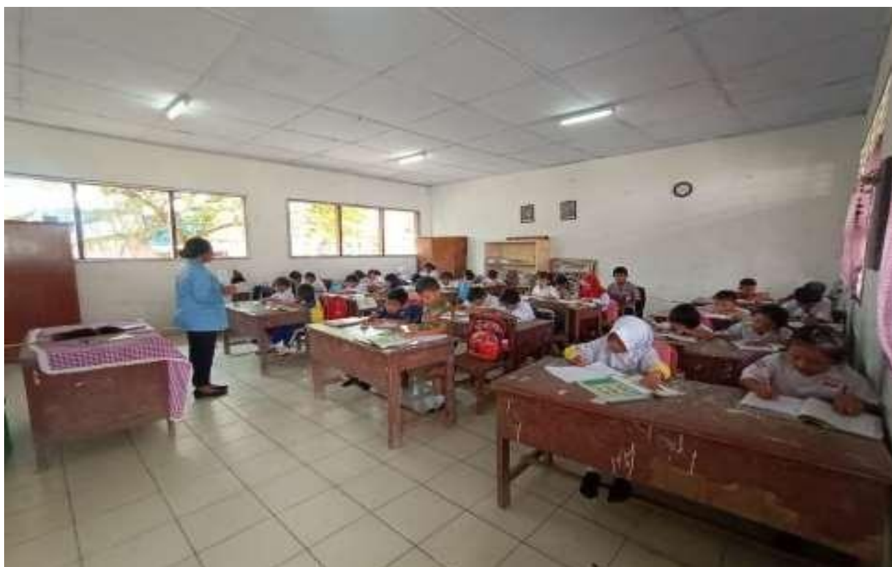
Gambar 2. Suasana Kelas Pembelajaran dengan system layanan bimbingan gratis

Berdasarkan hasil tingkat kepuasan peserta kegiatan sosialisasi sistem layanan bimbingan belajar gratis, maka diperoleh bahwa peserta kegiatan PKM 84 % menyatakan sangat setuju dan 16 % setuju dengan kegiatan ini dan tidak ada peserta yang menyatakan tidak setuju