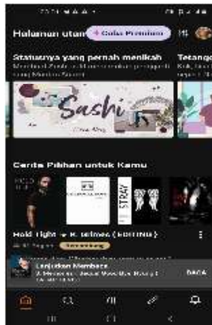
Gambar 2.1 Tampilan Awal Aplikasi Wattpad Via Mobile

Tampilan menu dalam telepon genggam terlihat lebih simple karena langsung menampilkan menu yang berisi kategori tulisan yang ada di Wattpad. Apabila ada pemberitahuan dari tulisan yang sedang pengguna ikuti maka akan langsung muncul di menu notifikasi.