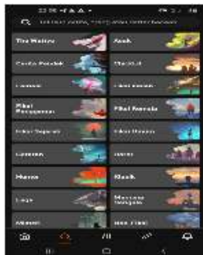
Gambar 2.3. Tampilan Fitur Genre di Aplikasi Wattpad

Jika dia memilih, dia bisa memasukkan bacaan yang dia pilih ke dalam library perpustakaan sehingga dia bisa membaca dalam waktu yang tidak terbatas. Selain itu, untuk meminimalkan ruang penyimpanan data dalam gadgetnya, maka bacaan yang telah dipilih itu dimasukkan ke dalam archipe/arsip. Banyak ditemui seseorang yang membaca novel yang sama berulang kali sehingga archive/arsip dibuat untuk keperluan tersebut.