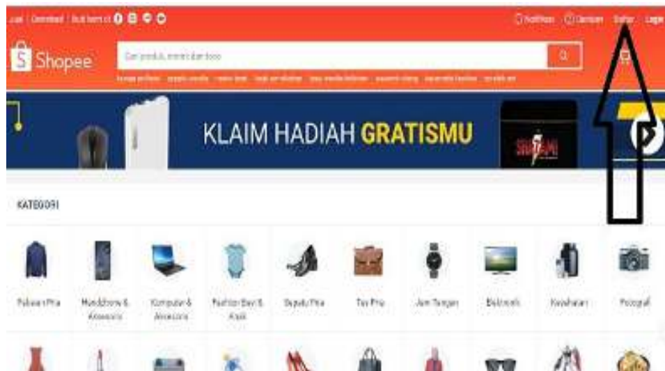
Gambar 1.2 Beranda Aplikasi Shopee pada Smartphone