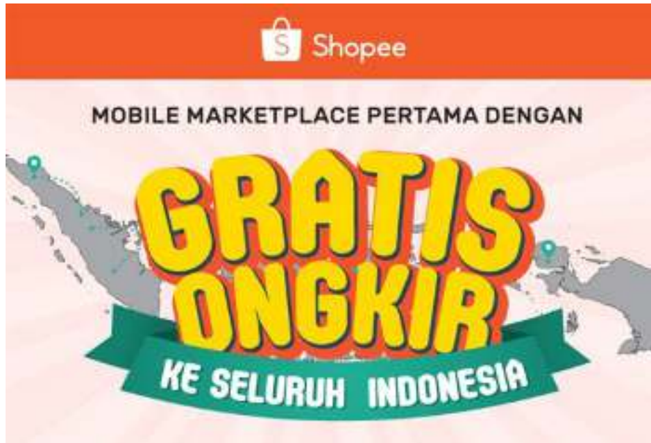
Gambar 1.4 Kampanye gratis ongkir ke seluruh Indonesia oleh SHOPEE