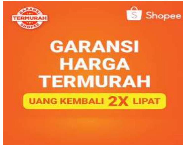
Gambar 1.3 Kampanye garansi harga termurah dari SHOPEE