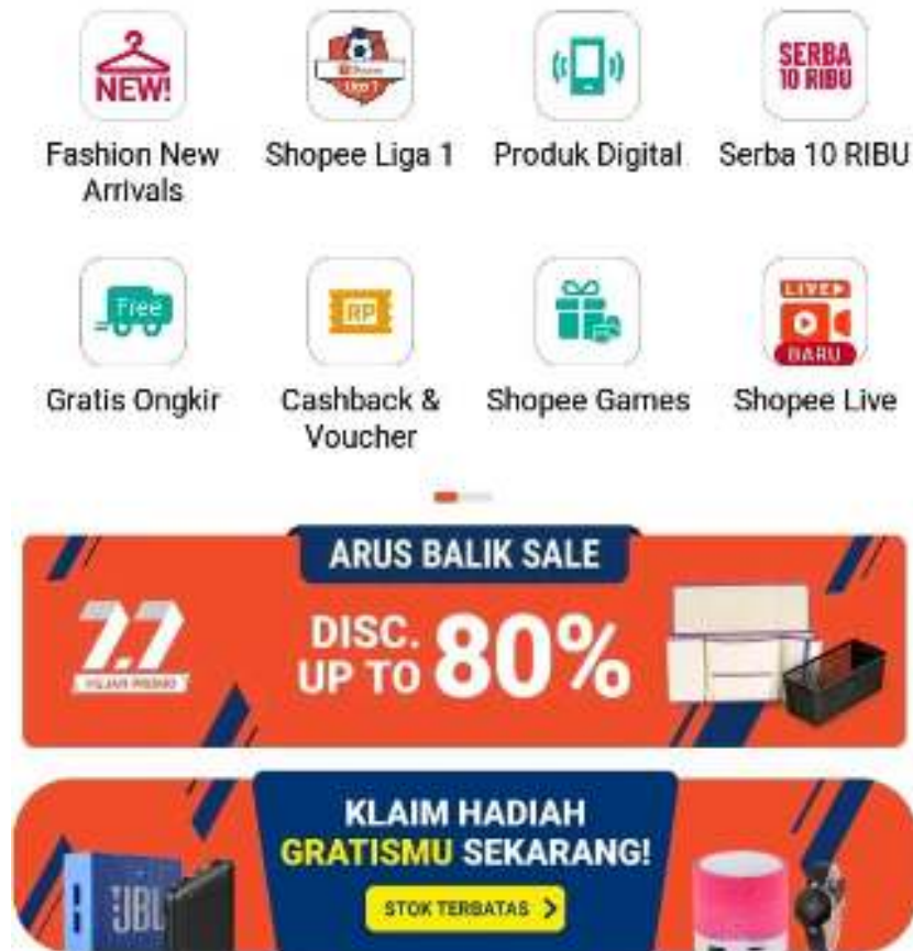
Gambar 1.5 Beranda Shopee pada Aplikasi