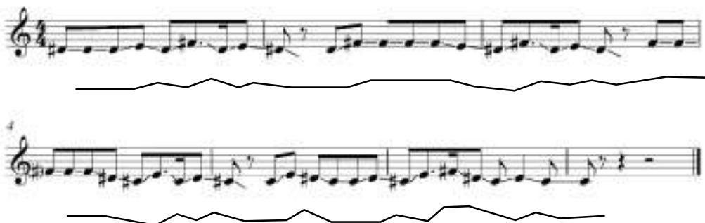
Gambar 4.2.10 Kontur melodi conjunct pada Bagian C (Rewrite: Penulis)