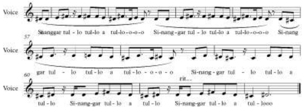
Gambar 4.1.8 Melodi pengulangan Bagian B (Rewrite: Penulis)

birama 61 dinyanyikan secara ritardando menandakan akhiran lagu. Pengulangan Bagian B ditutup dengan nada panjang pada nada D# atau tingkat III dari tangga nada B pentatonik yang digunakan pada lagu ini.