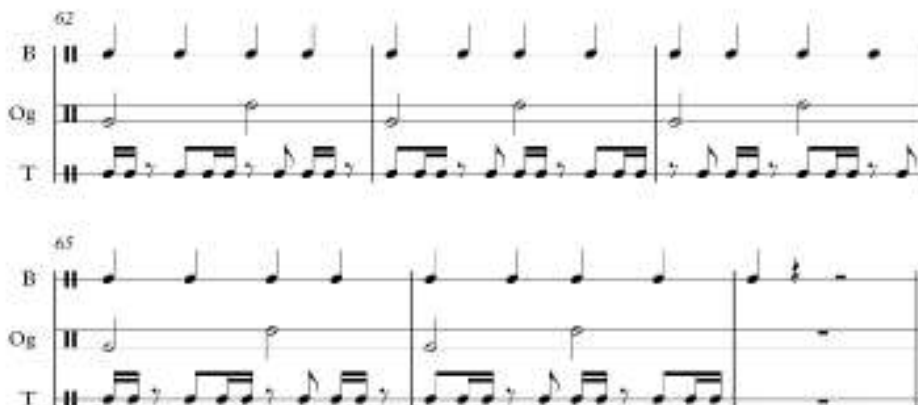
Gambar 4.1.9 Bagian outro birama 63-67 pada lagu Sinanggar Tullo (Rewrite: Penulis)

Outro lagu Sinanggar Tullo terdiri dari empat bar terakhir yang hanya berisi beat , taganing , dan ogung . Sama seperti pada bagian intro yang memberikan kesan hampa. Beat berhenti pada birama 67 ketukan pertama, sehingga membuat lagu ini diakhiri dengan sebuah birama gantung.