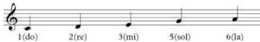
Gambar 2.1.2 Tangga Nada Pentatonik Batak Toba 2 ( Rewrite: Penulis )