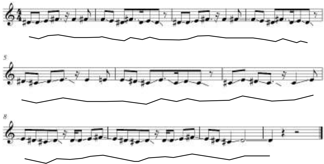
Gambar 4.2.9 Kontur melodi conjunct pada Bagian B (Rewrite: Penulis)