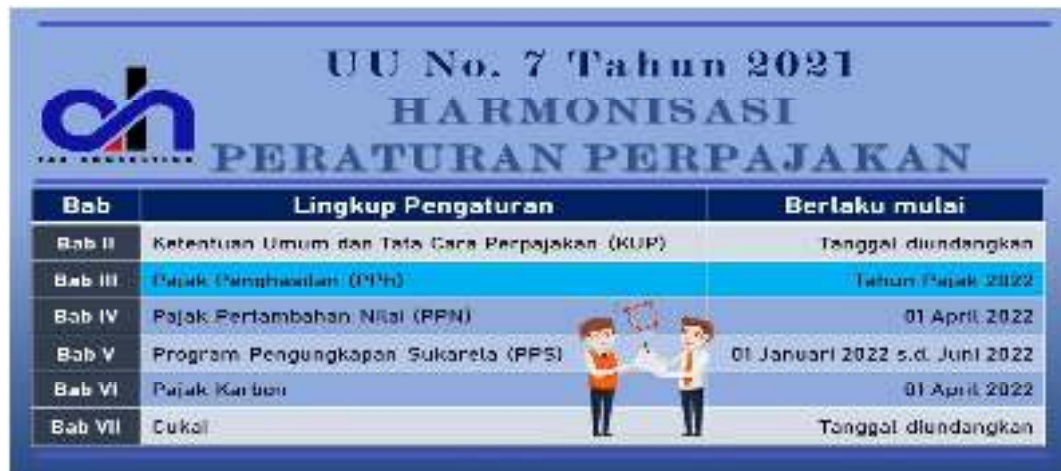
Gambar 2. 1 Undang-Undang Harmonisasi Peraturan Perpajakan